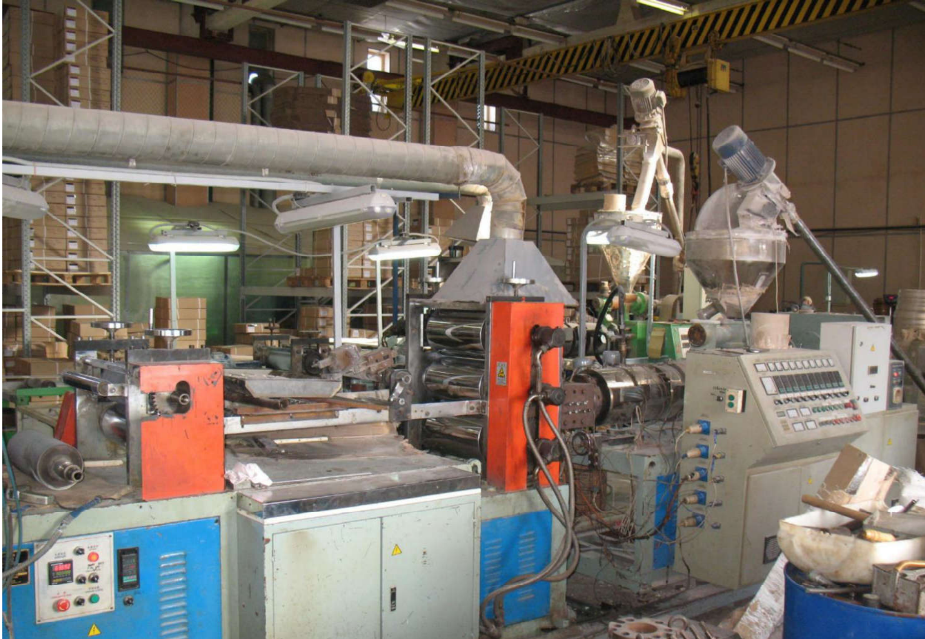
Цех производства мебельной кромки ПВХ