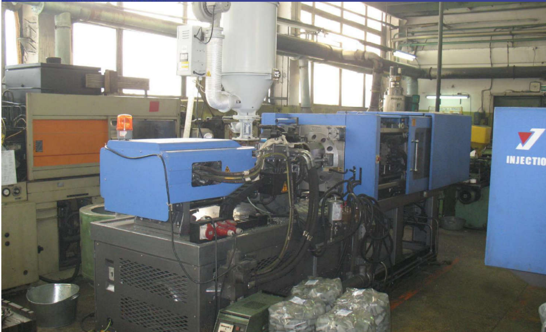
Цех литья пластмасс под давлением