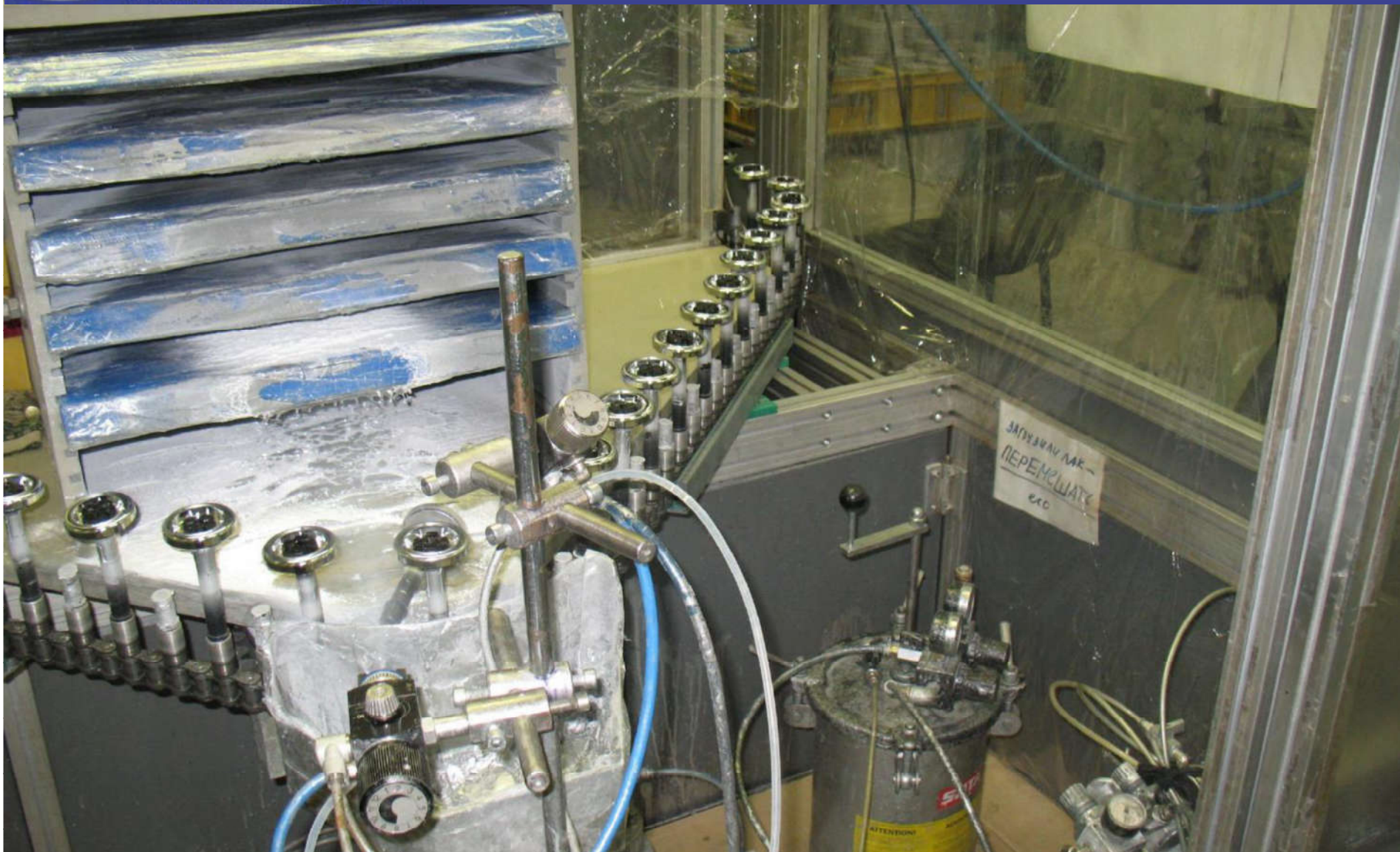
Автоматическа окрасочная установка