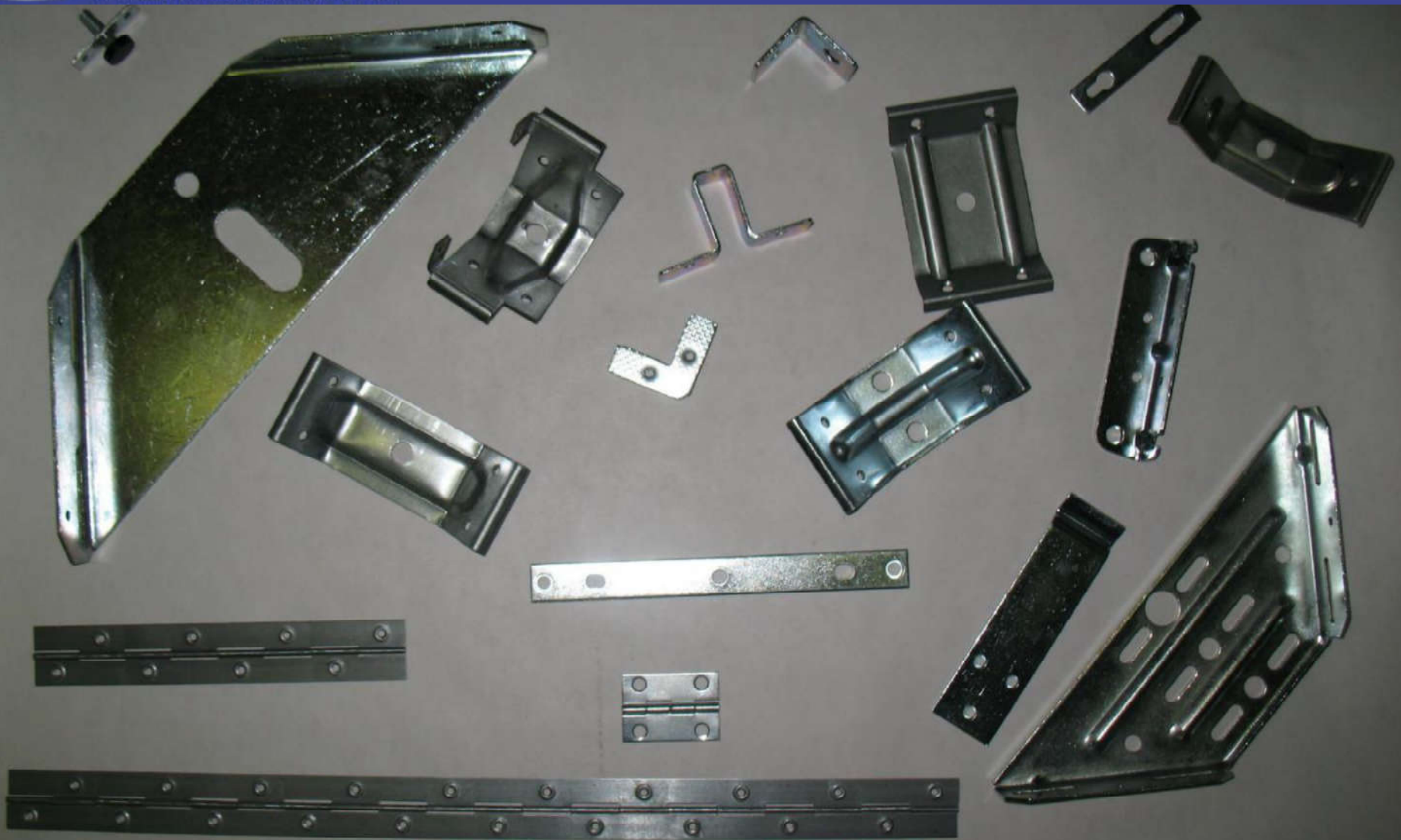
Детали полученные листовой штамповкой