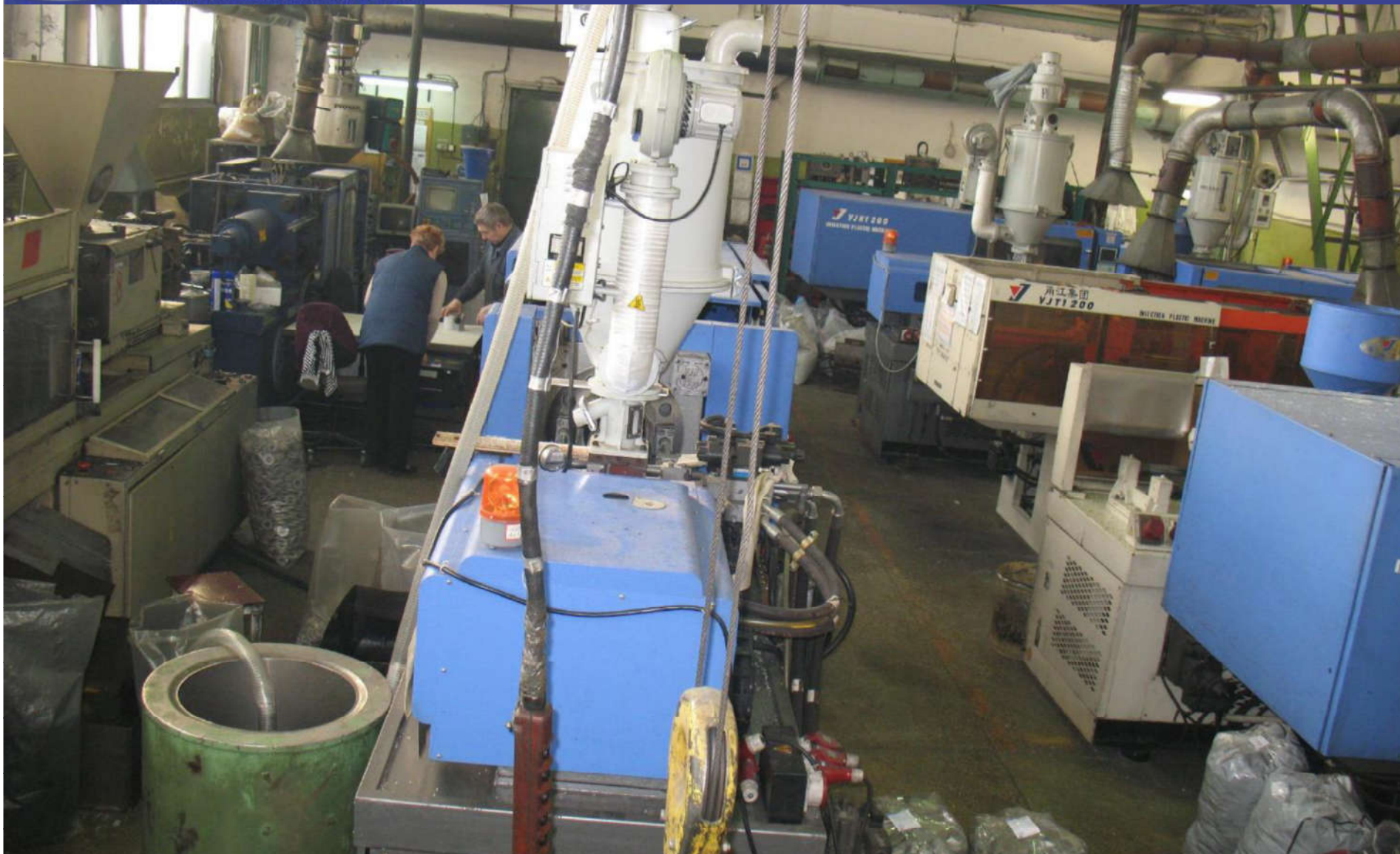
Цех литья пластмасс под давлением