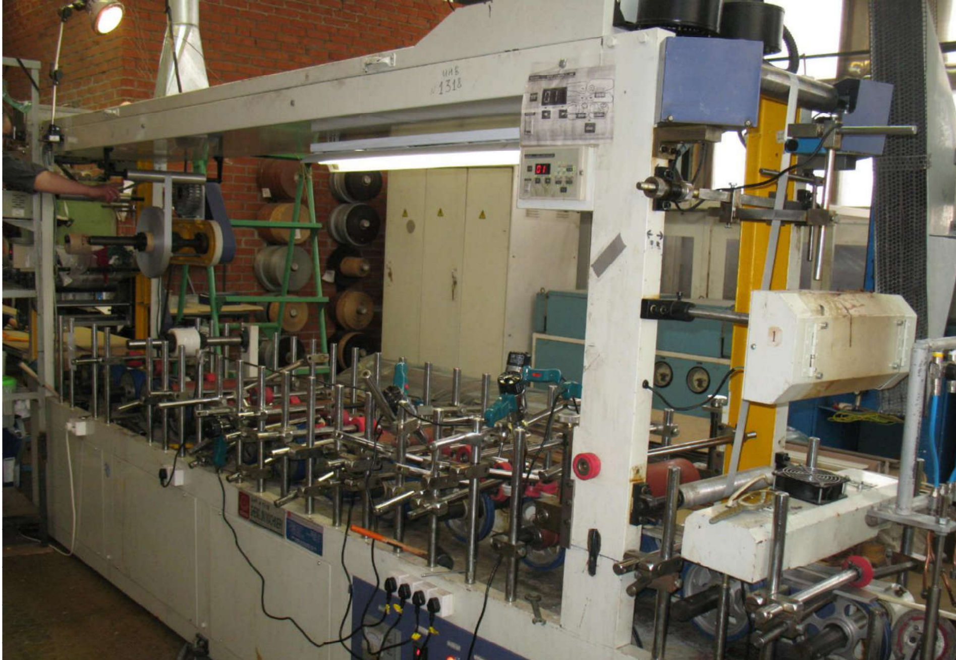
Участок ламинирования цеха экструзии