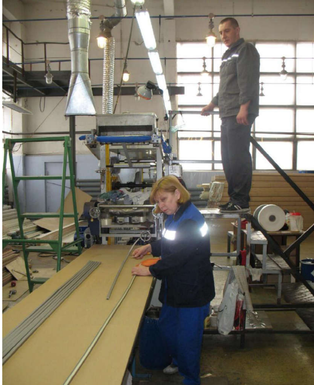
Участок ламинирования цеха экструзии