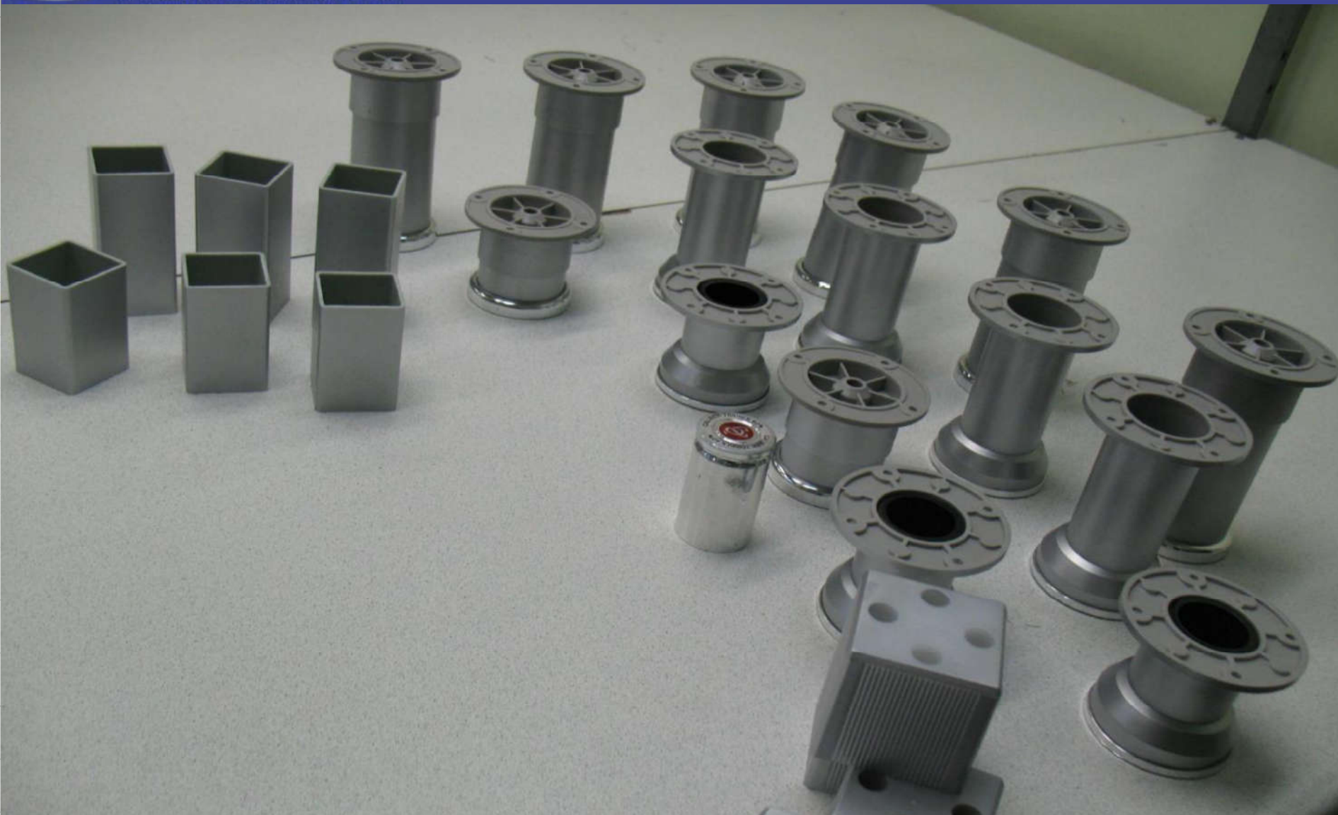
Детали с элементами вакуумного напыления