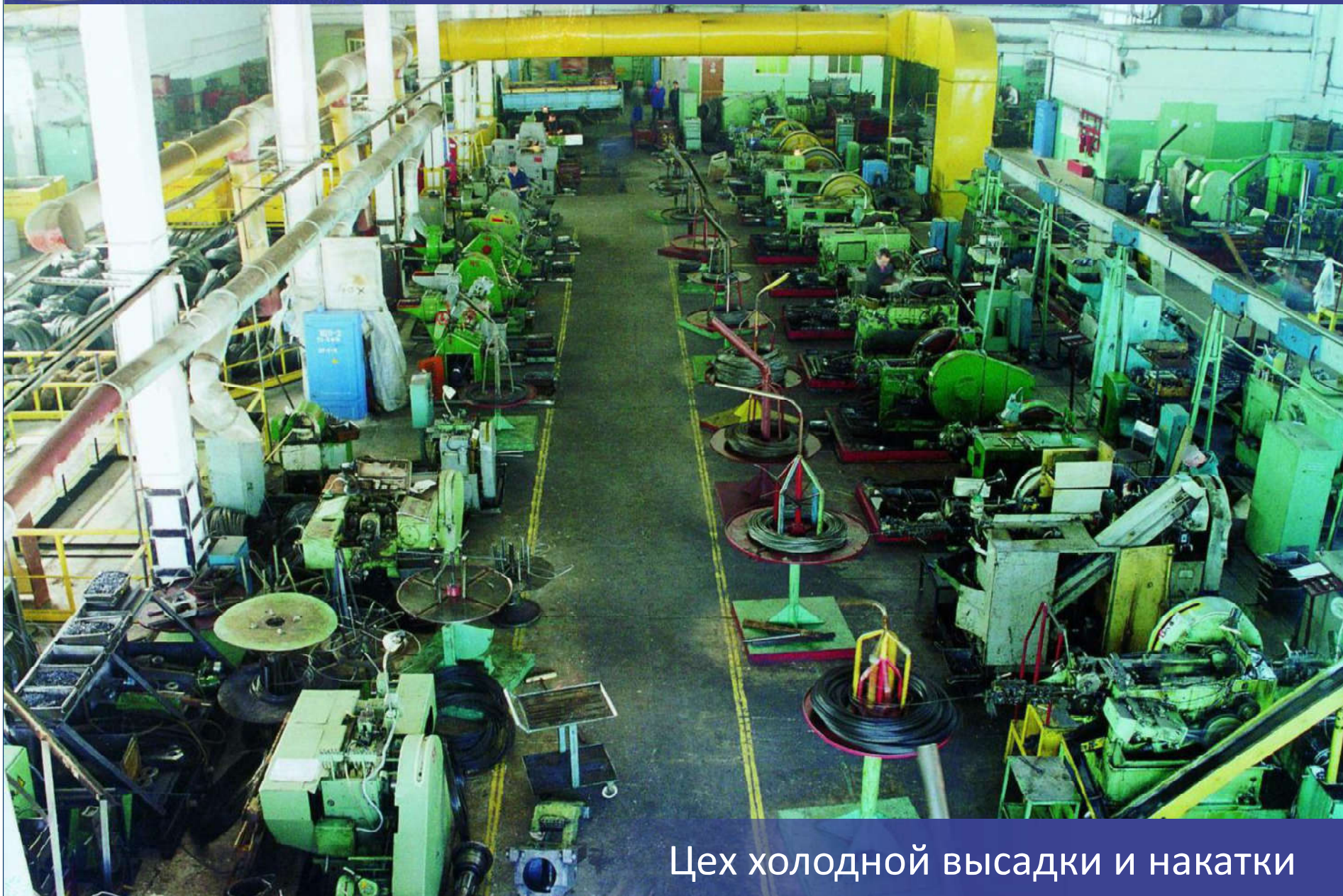
Цех холодной высадки и накатки