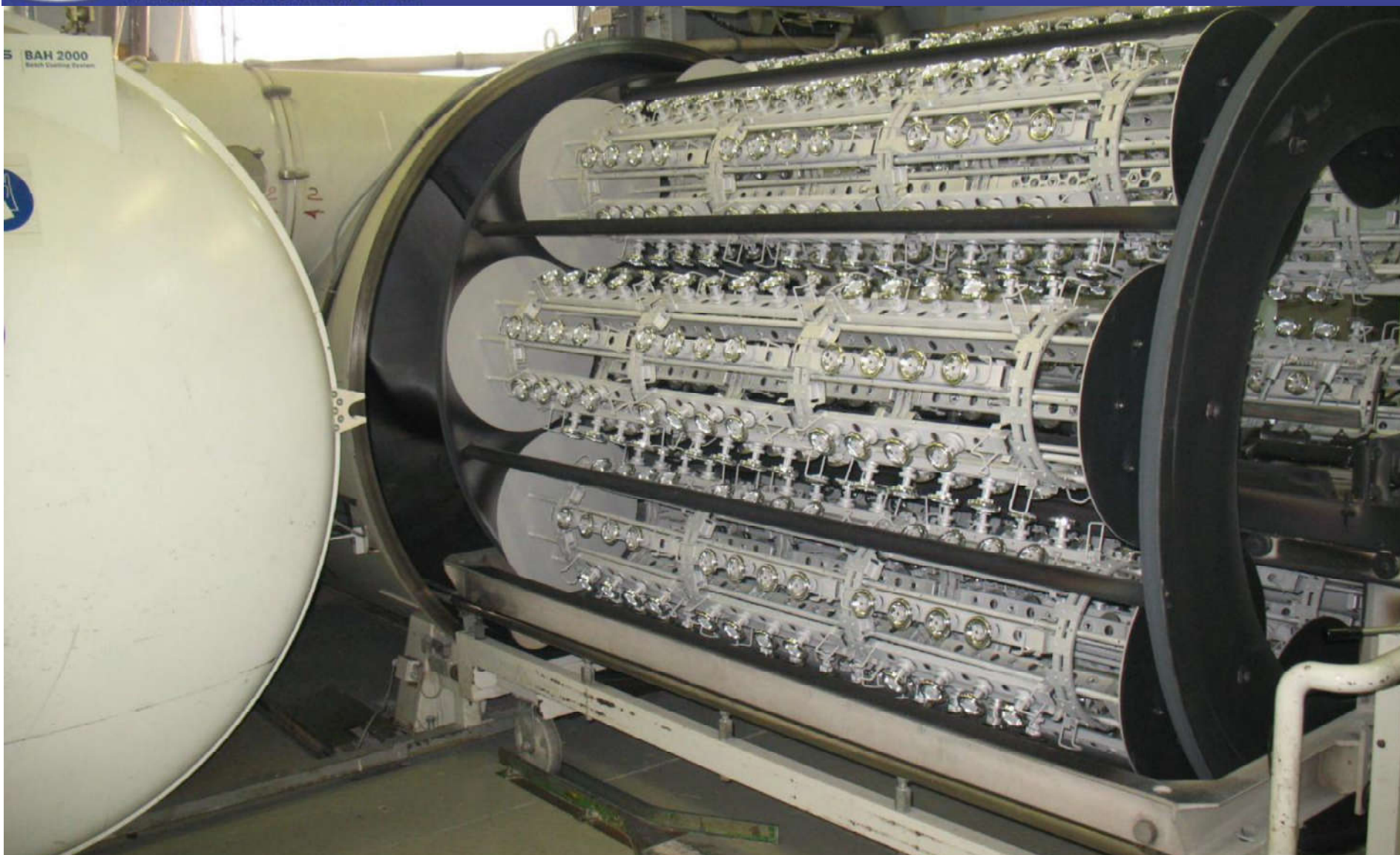
Установка вакуумного напыления