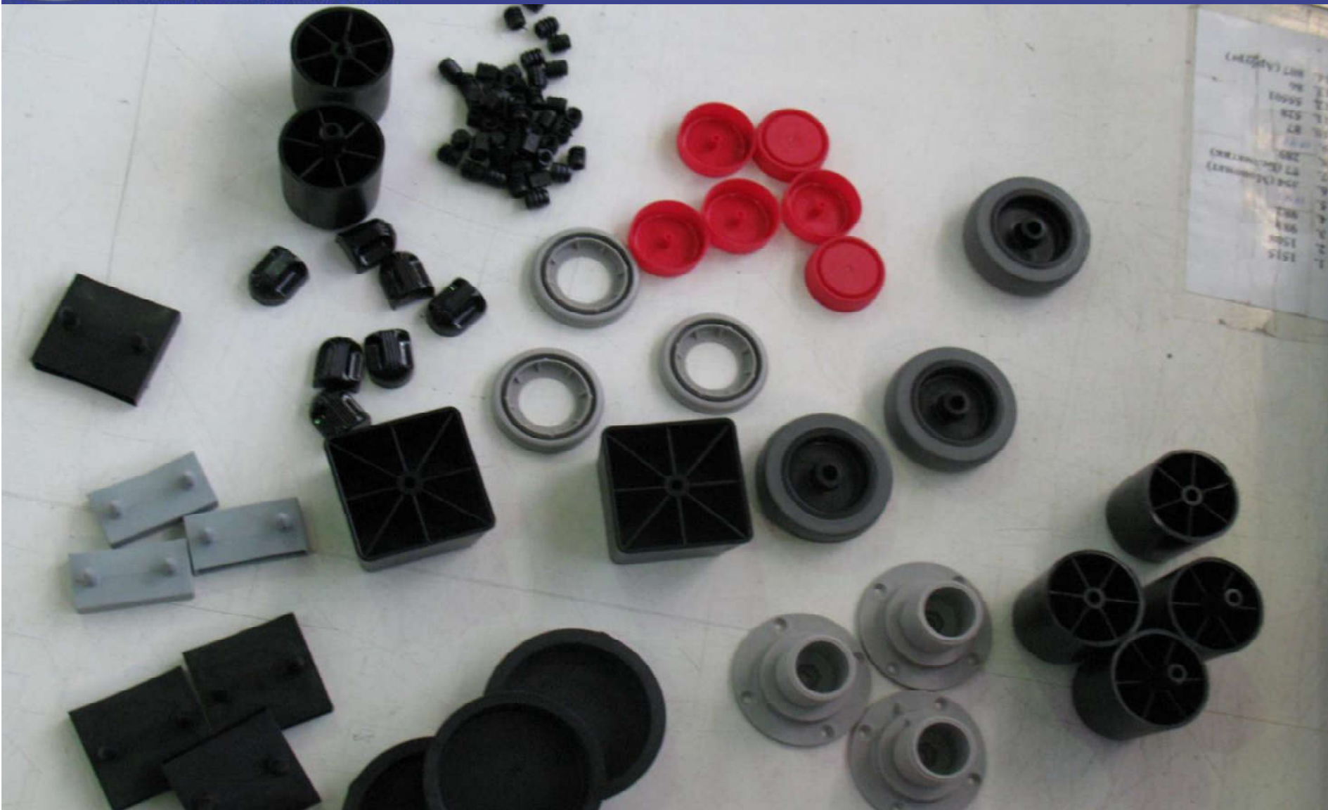
Изделия из пластмасс