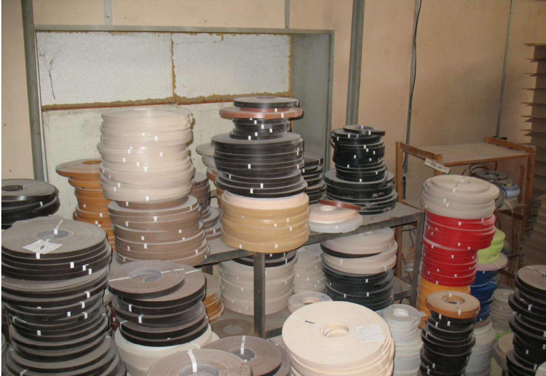
Мебельная кромка ПВХ